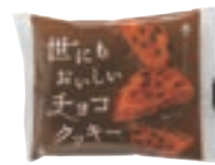
世にもおいしい チョコクッキー