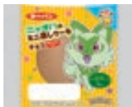
ニャオハのミニ蒸しケーキ チョコ カルシウム入り