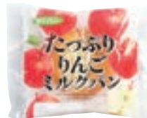
たっぷりりんごミルクパン