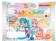
プリキュア ふんわりくもパン アップル&クリーム