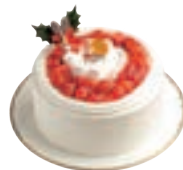
苺のクリスマスケーキ