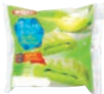
冷やしてもおいしい クラウンメロンパン

40周年を迎えた「アップルリング」や根強い人気のテレビアニメキャラクターの商品をはじめ、多くの皆様をご存知の企業様とコラボレーションした商品、大人も子供も大好きな惣菜パン、スイーツのようなパンなど、お客様に喜んでいただける商品作りに取り組んでおります。