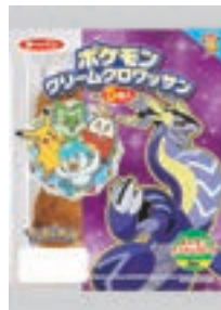
ポケモンクリームクロワッサン 5個入